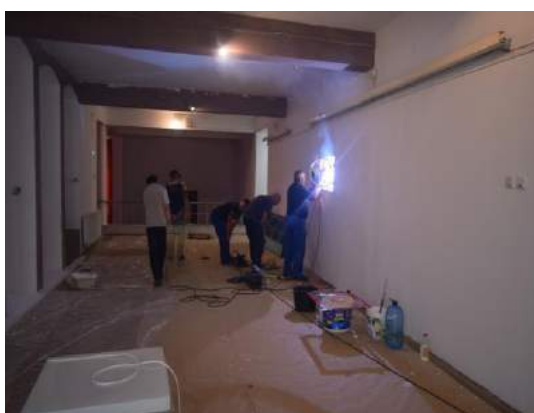
Aspecte din timpul lucrărilor de reamenajare